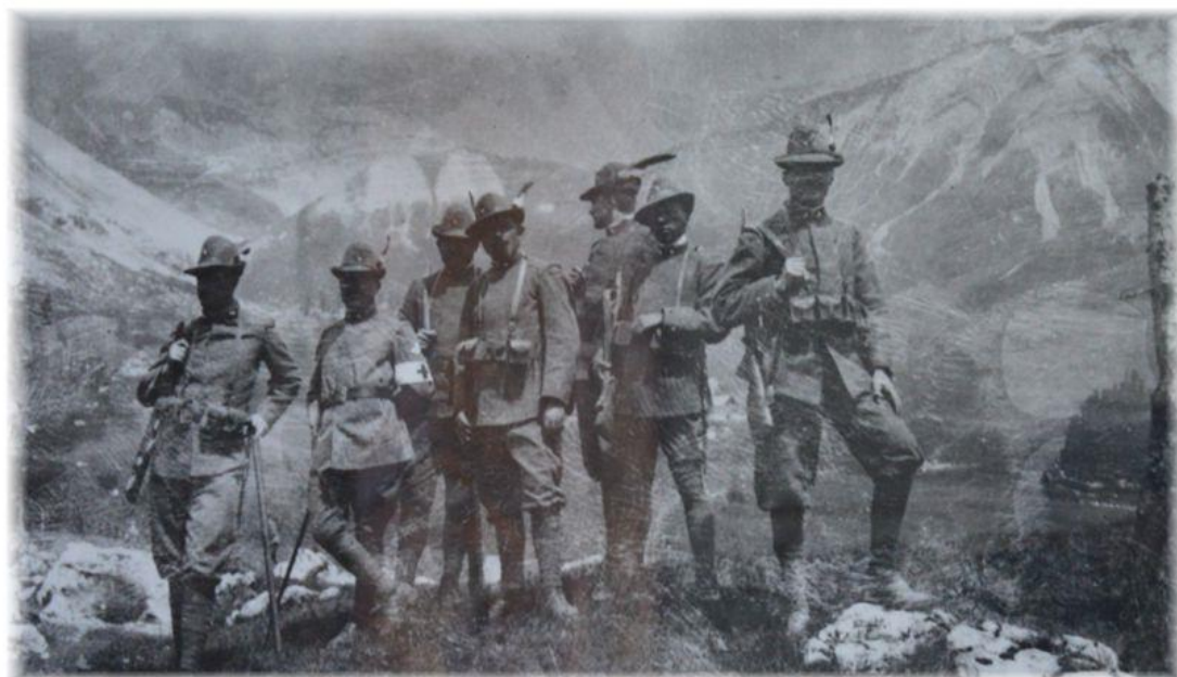
Ufficiali del Battaglione Val Cordevole a Fucchiade, più o meno nel punto in cui avvenne la valanga