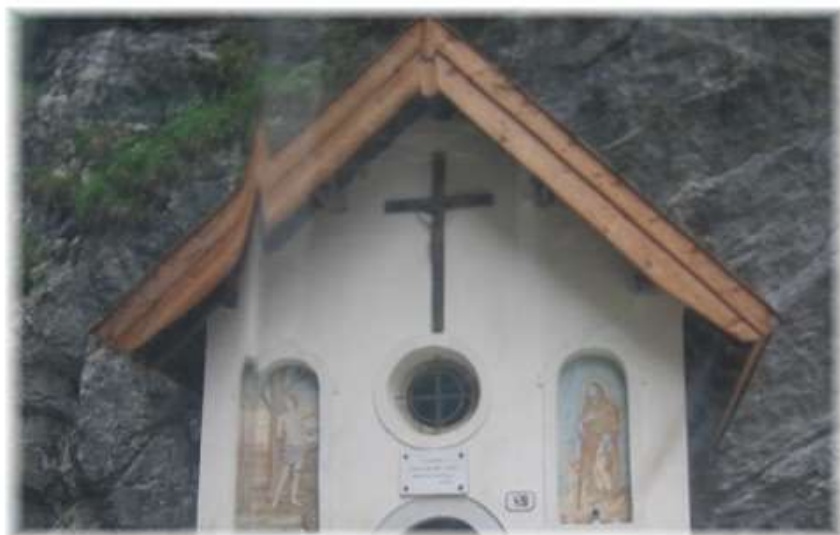
Cappella nei Serrai in ricordo del Cimitero Militare di Malga Ciapela

Atto di morte Comune Rocca Pietore: di anni 18, morto alle ore 9 in località Laverda