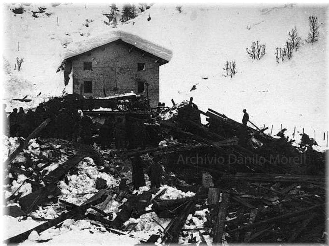
Un'altra immagine della valanga che colpì parte delle abitazioni di Sottoguda: la casa che si vede è l'attuale Ciesa la Vèrda.