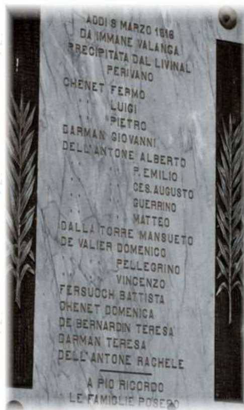
Sopra a sinistra: la chiesetta a Sottoguda con la targa in memoria del Cimitero di Salere. A destra: la lapide in memoria degli operai e civili morti nella valanga, posta all'interno della Chiesa.