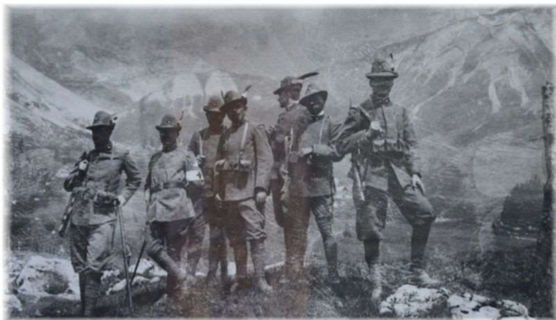
Ufficiali del Battaglione Val Cordevole a Fuciade, più o meno nel punto in cui avvenne la valanga