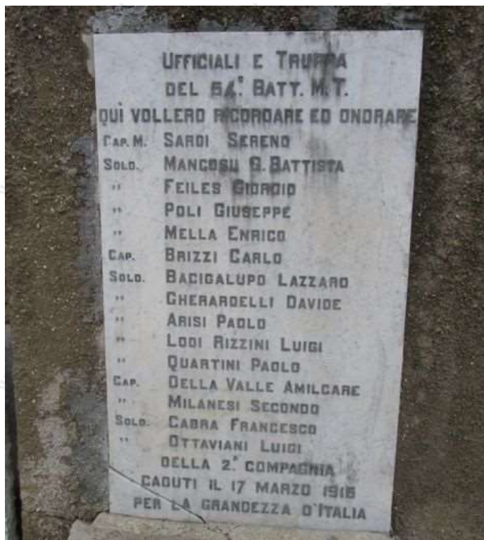
Lapide presente nel Cimitero di Pieve di Ledro in memoria dei caduti. Evidente l'errore della data della Valanga.

Albo dei Caduti: da Genova (d.m. di Genova), Caporal Maggiore 64° Battaglione M.T., morto il 12/03/1916 nel Settore Tolmino in seguito a caduta di valanga