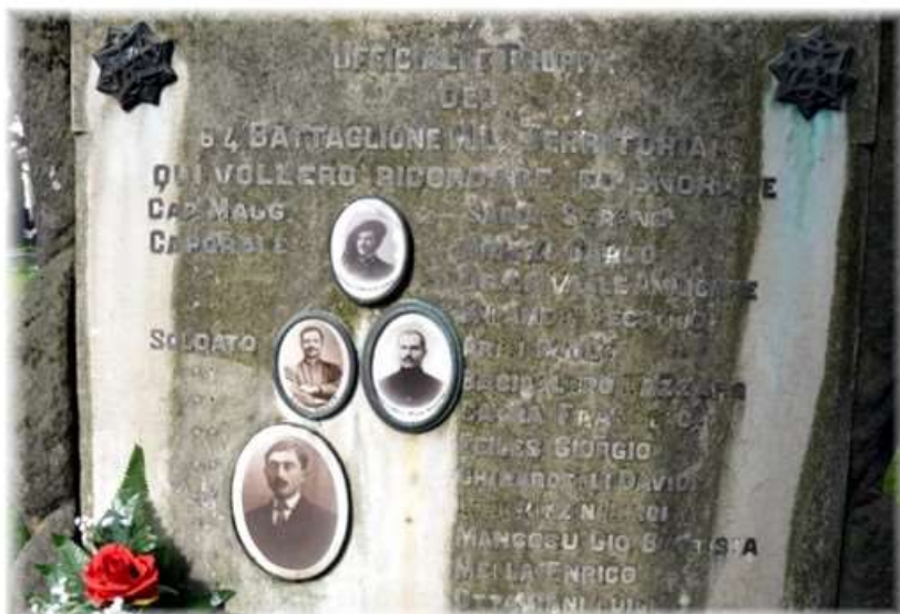
Lapide in memoria dei caduti della valanga nel Cimitero di Cremona

Alcuni militari appartenenti al 64° battaglione M.T. 2ª compagnia, altri militari alla 372ª Batteria Artiglieria da Campagna. Numero vittime: 16. I militari furono sepolti dapprima a Ledro, poi traslati al Sacrario Casteldante di Rovereto