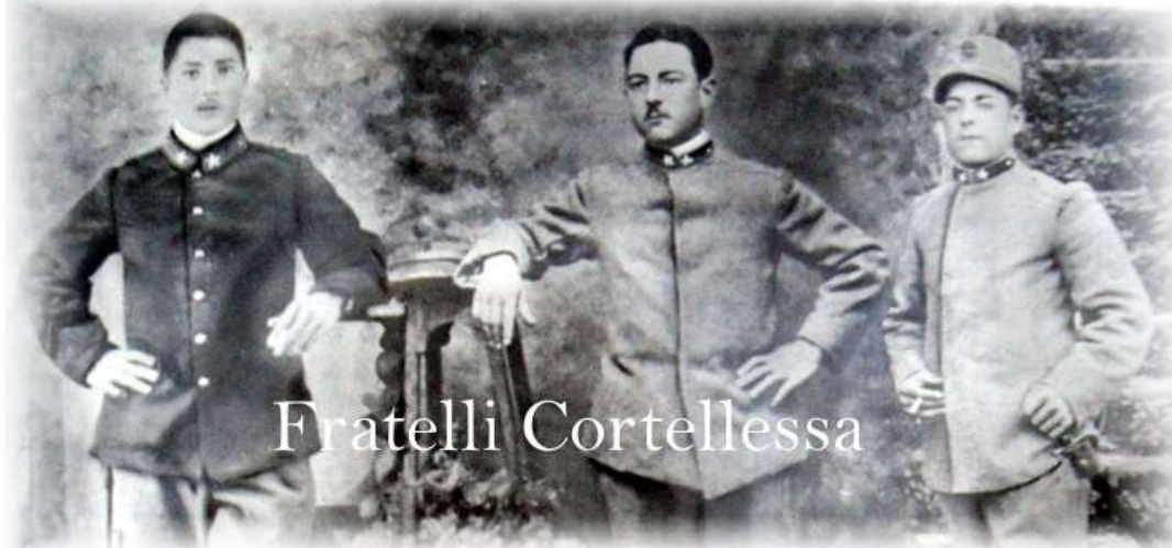
Da una segnalazione di Ambrosi Mauro