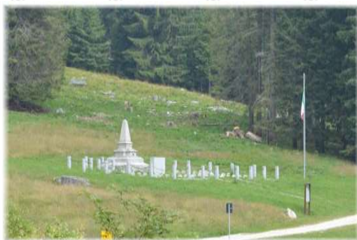
Ex-cimitero militare di Malga Sorgazza, 1923. A destra, il cimitero oggi