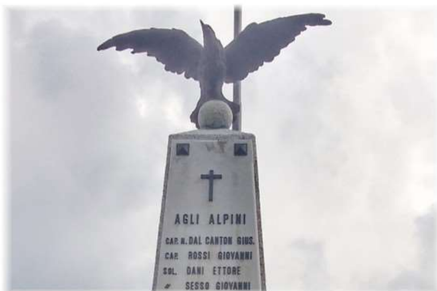
Foto del monumento al Passo Brocon

I soldati furono inizialmente sepolti a Passo Brocon