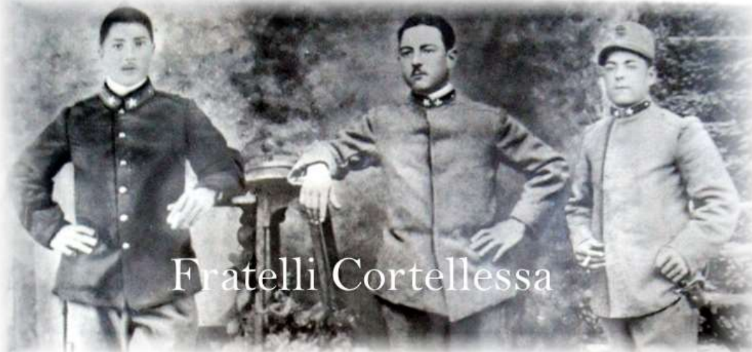
Da una segnalazione di Ambrosi Mauro